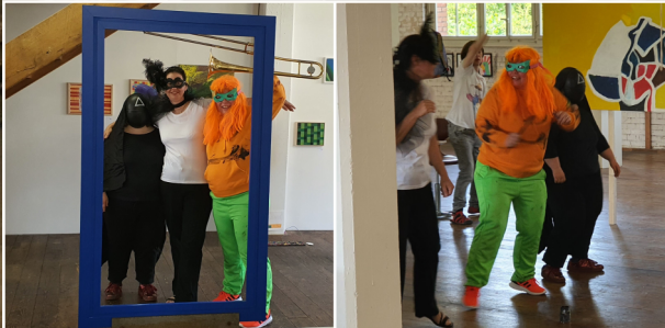
Unsere Ausstellung «KUNST VOLLER TRAUM II» Die Vernissage mit vielen Besuchern